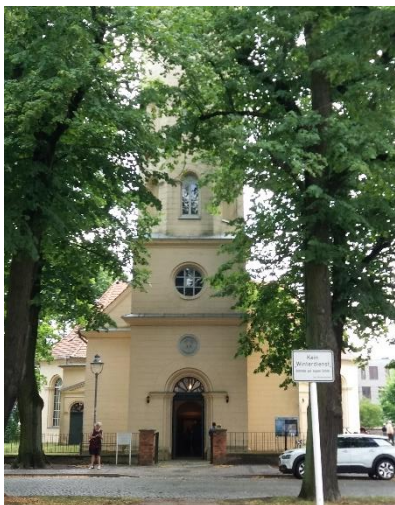
Kreuzkirche Königs Wusterhausen