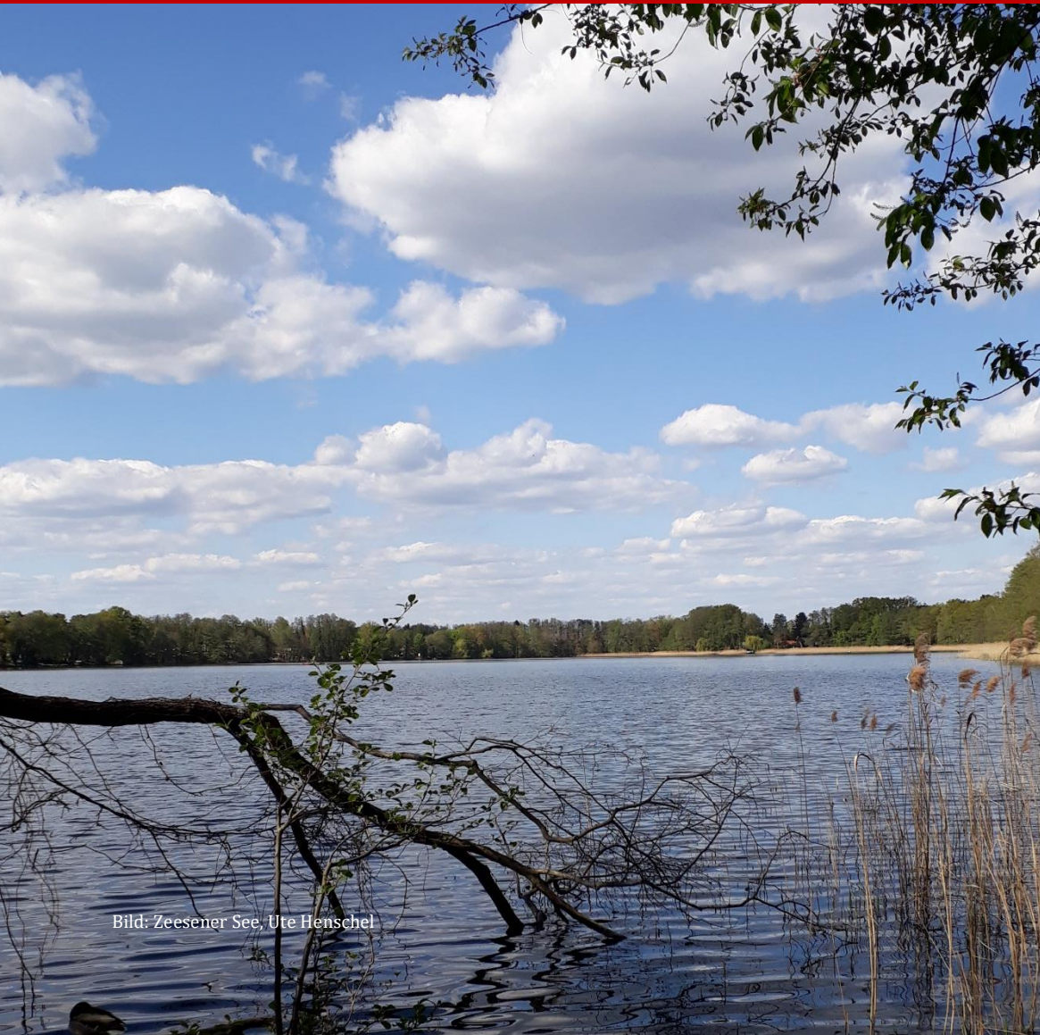
Bild: Zeesener See